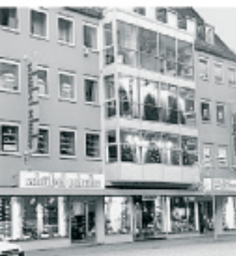
Top-Duo unter einem Dach: Schübel Schuhe und Schuh-Hofmann.

„Schübel Schuhe“ feiert 111. Geburtstag – Sonderpreise auf das gesamte Sortiment – Kompetenz in Mode und Passform