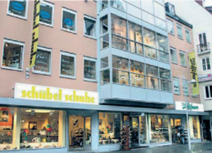
Zwei gute Adressen unter einem Dach: „Jubiläum“ Schübel Schuhe und Schuh-Hofmann ergänzen sich mit ihrem Sortiment bestens.